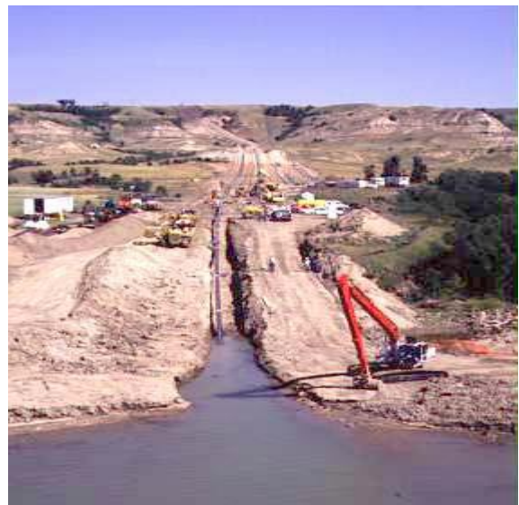
Transport CO 2 iz SAD u Kanadu

Pri skladištenju CO 2 , glavni rizik je neispravnost utisne bušotine, što može dovesti do propuštanja utiskivanog CO 2 . Mogućnost iznenadnog izlaska CO 2 iz podzemnog ležišta veoma je mala i usporediva je s erupcijama prirodnog plina iz plinskih ležišta, koje su jako rijetke.