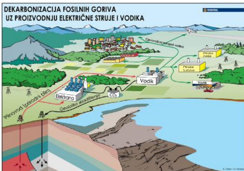
Moguća budućnost: iz fosilnih goriva dobivaju se električna struja i vodik, dok se CO 2 sprema u geološke formacije u podzemlju

www.climnet.org/CTAP : CAN, the Climate Action Network, mreža nevladinih organizacija za zaštitu okoliša, održala je posebni radni seminar ( workshop ) o CCS.