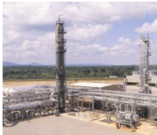
Postrojenje za uklanjanje CO 2 iz otpadnog plina (ABB Lummus Crest)

Sva fosilna goriva sadrže ugljik. Prilikom izgaranja, ugljik se spaja s kisikom iz zraka stvarajući CO 2 . Uklanjanjem ugljika prije ili poslije procesa izgaranja, napr. u termoelekttranama, sprječava se ispuštanje CO 2 u atmosferu. Uređaj za uklanjanje CO 2 tako postaje izvor koncentriranog CO 2 , kojeg treba transportirati u podzemno ležište. Podzemno ležište može biti iscrpljeno ležište nafte ili plina, duboki slojevi ugljena ili vodonosnici (stijene ispunjene slanom vodom).